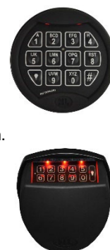
Knappsats PI2030 & QT2030