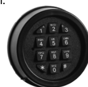
Knappsats AL2020 & AL2030