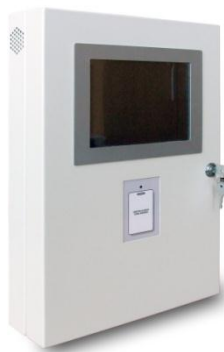
Dator och kortläsar moduler